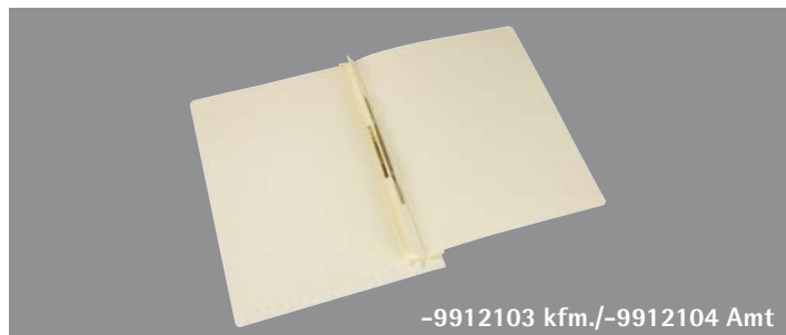
-9912103 kfm./-9912104 Amt