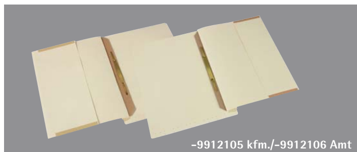
-9912105 kfm./-9912106 Amt