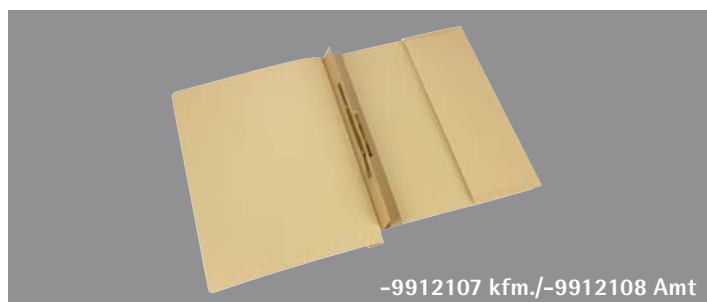
-9912107 kfm./-9912108 Amt