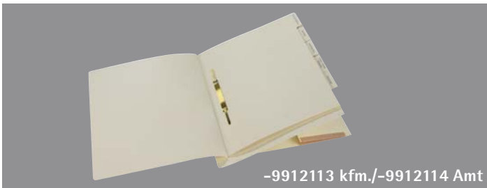
-9912113 kfm./-9912114 Amt

-11/-12: → AHS (VD/RD): 305/323 (kfm.), 323/305 (Amt) → Höhe (VD/RD): 272/270 (kfm.), 270/272 (Amt) → OC-Tab: RD (kfm.), VD (Amt) 18 mm → Tasche: am VD (kfm.), am RD (Amt) seitlich mit Streifen Höhe 105, mit Fröschen Höhe 150, Füllvermögen 30 mm -13/-14: → AHS (VD/RD): 305 (kfm. + Amt) → Höhe (VD/RD): 268 (kfm. + Amt) → OC-Tab: 18 mm am letzten Trennblatt → Tasche: am RD (kfm./Amt) seitlich mit Streifen Höhe 105 oder Fröschen Höhe 105, Füllvermögen 30 mm → Material g/m 2 : Kraft 260/320, Manila A 250/320 → Farben Manila: chamois, gelb, rot, h-blau, blau, grün, grau → Beschlag: Pendel- oder Zentralbeschlag, Metall oder Kunststoff → Stanzungen: OrgaClass oder ohne → Druck: Markierungslinien auf OC-Tab, Sonderdruck außen → Trennblätter: → Material g/m 2 : Kraft 260, Manila 250 (Umschlagfarbe) → Einlagen: max. 4, bei 1-3 Trennblättern auch zusätzlich 1 Natronkartonfalz möglich → Tastenausstanzungen: gemäß Anzahl Trennblätter oder eine zusätzliche → Heftfalz: mit Metallaufreihband → Sonderdruck: einseitig auf den Trennblättern