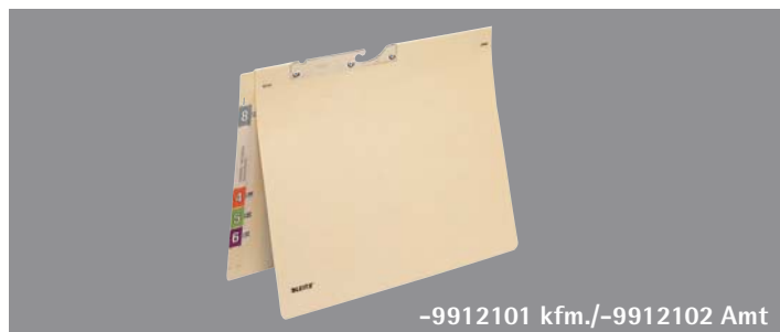
-9912101 kfm./-9912102 Amt

Auf Wunsch liefern wir Ihnen Ihre gesamte Registratur natürlich auch gebrauchsfertig konfektioniert.