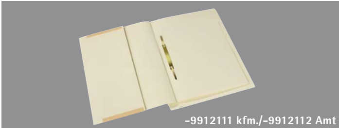
-9912111 kfm./-9912112 Amt

→ AHS (VD/RD): 305/323 (kfm.), 323/305 (Amt) → Höhe (VD/RD): 270 → OC-Tab: RD (kfm.), VD (Amt) 18 mm → Material g/m 2 : Kraft 260/320, Manila A 250/320 → Farben Manila: chamois, gelb, rot, h-blau, blau, grün, grau → Beschlag: Pendel- oder Zentralbeschlag, Metall oder Kunststoff → Stanzungen: OrgaClass oder ohne → Druck: Markierungslinien auf OC-Tab, Sonderdruck außen → Trennblätter: → Material g/m 2 : Kraft 260, Natron 250, Manila 250 (Umschlagfarbe) → Einlagen: max. 4, bei 1-3 Trennblättern auch zusätzlich 1 Natronkartonfalz möglich, → Tastenausstanzung: gemäß Anzahl Trennblätter oder eine zusätzliche, → Heftfalz: mit Metallaufreihband → Sonderdruck: einseitig auf den Trennblättern