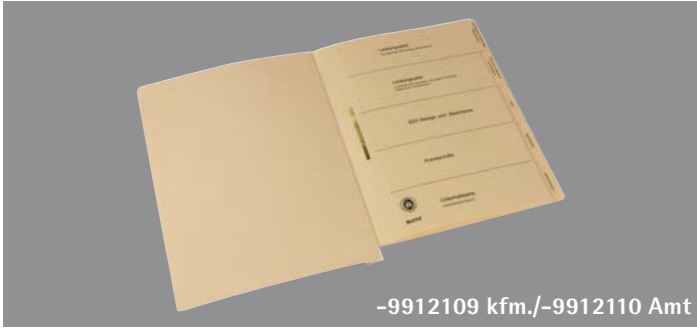
-9912109 kfm./-9912110 Amt